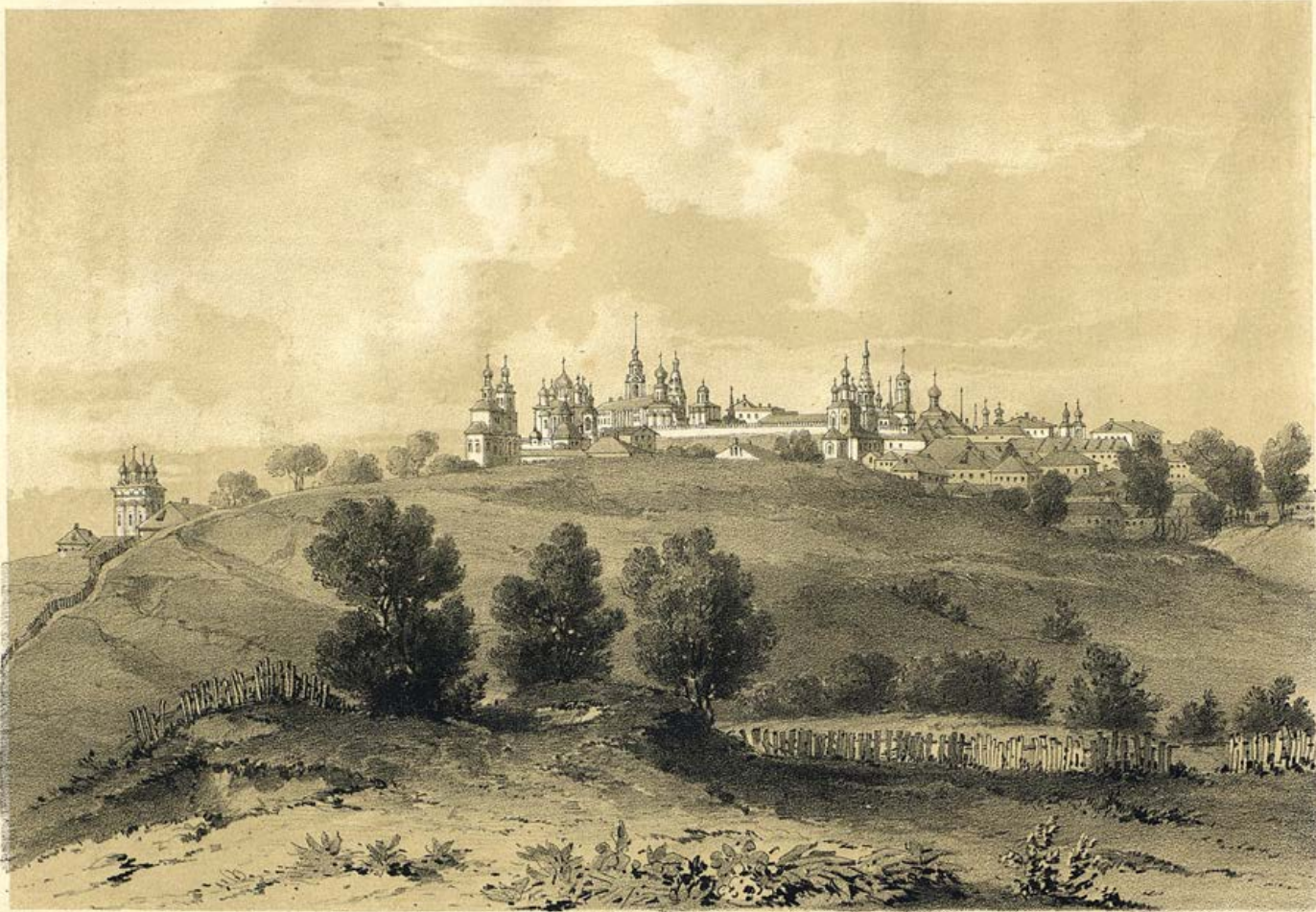
ВЛАДИМІРЪ НА КЛАЗЬМЪ.