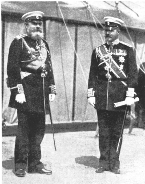
Слева – вице-адмирал Ф.К.Авелан, справа – контр-адмирал З.П.Рожественский