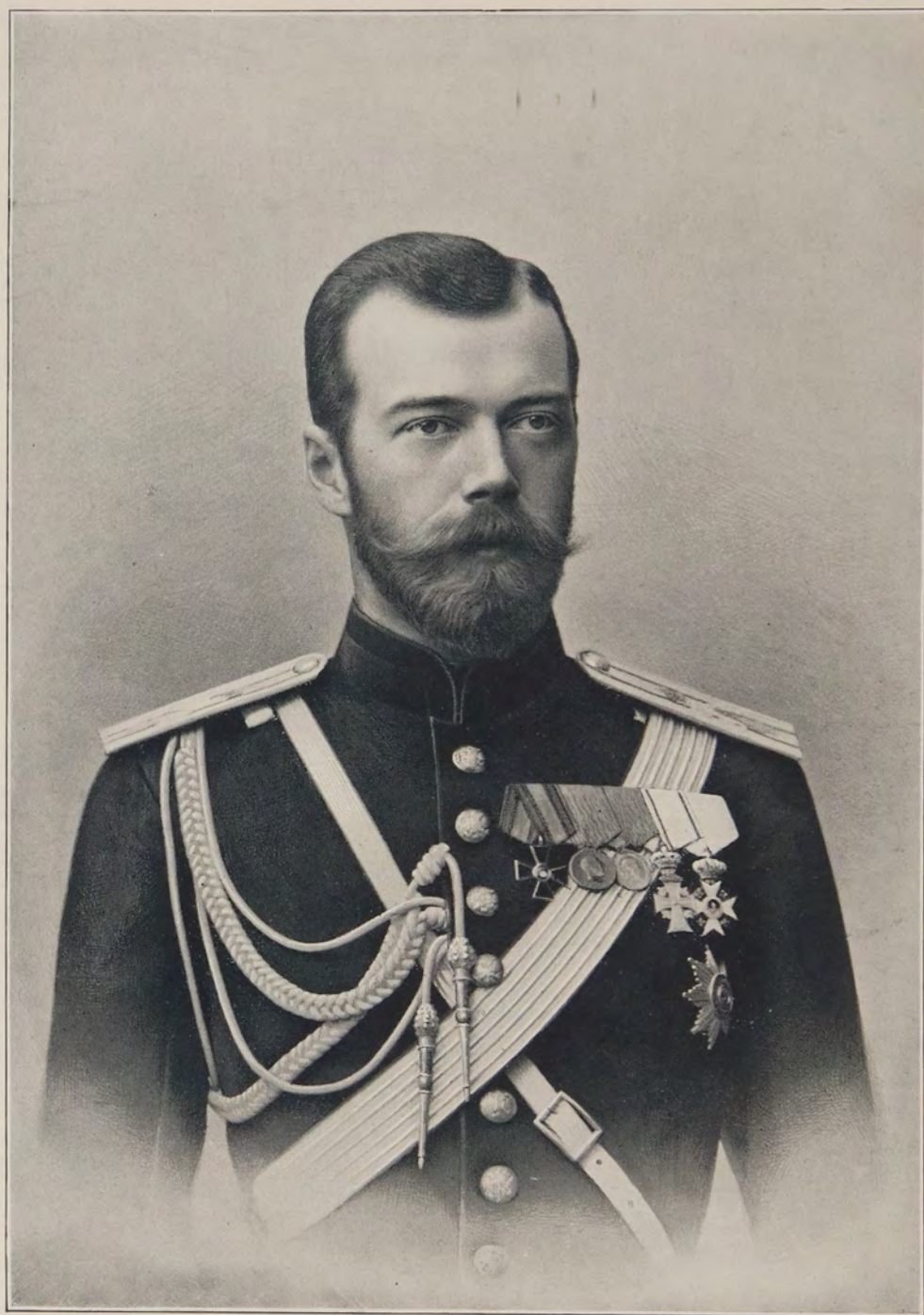
Его Императорское Величество Государь Императоръ НИКОЛАЙ АЛЕКСАНДРОВИЧЪ Самодержецъ Всероссійскій.