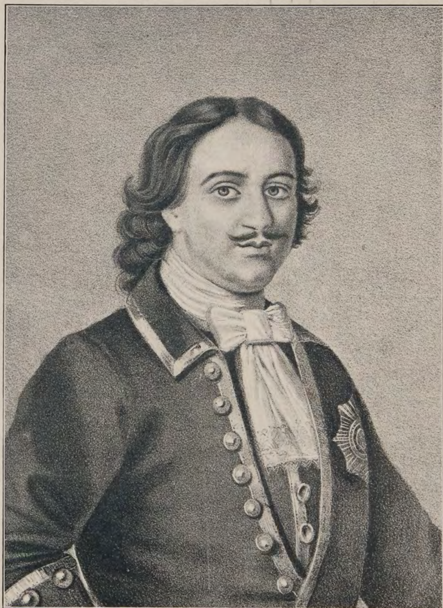
ИМПЕРАТОРЪ ПЕТРЪ ВЕЛИКІЙ.