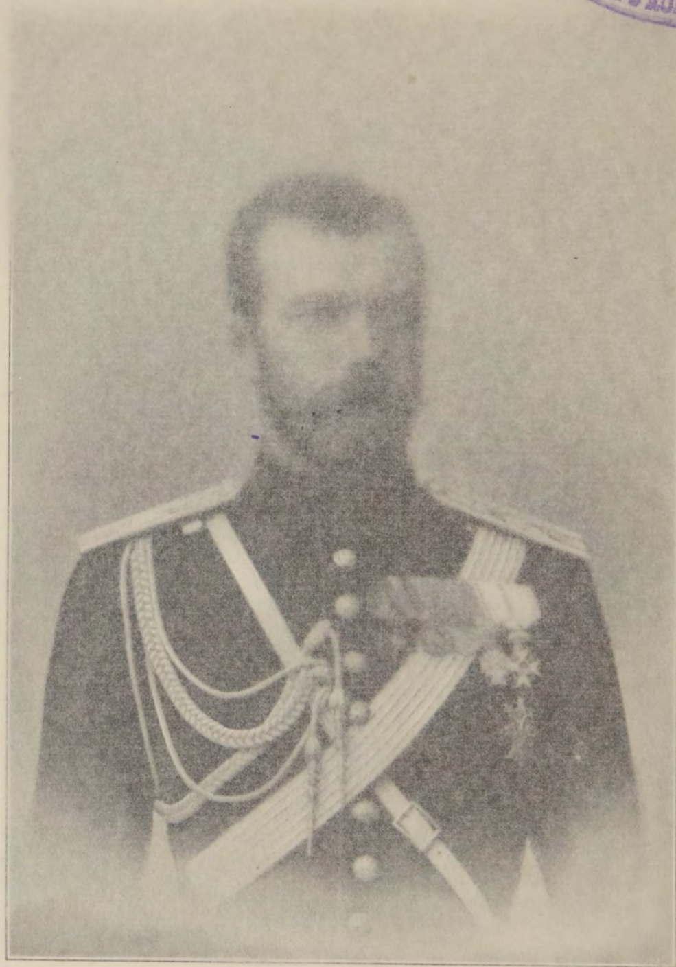
Его Императорское Величество Государь Императоръ НИКОЛАЙ АЛЕКСАНДРОВИЧЪ Самодержецъ Всероссійскій.