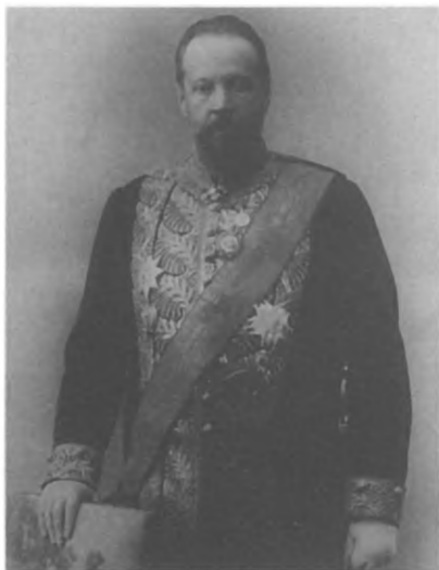
С. Ю. Витте