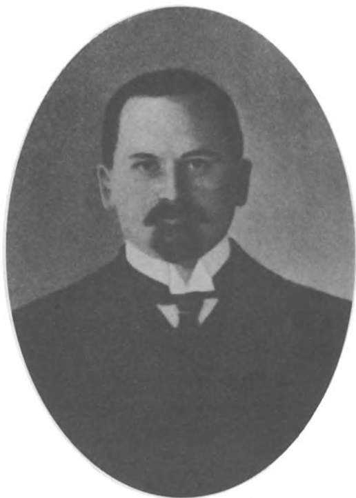
С. Е. Крыжановский. 1915 г.