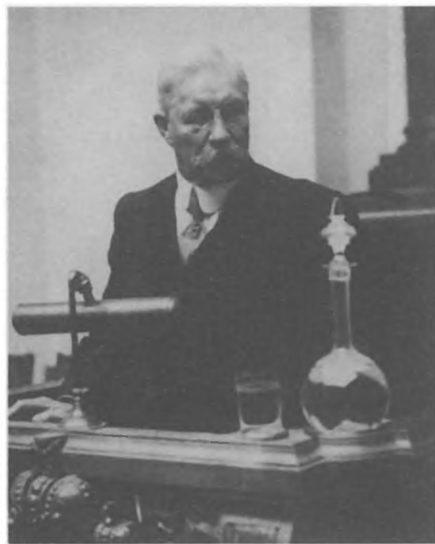
П. Н. Милюков