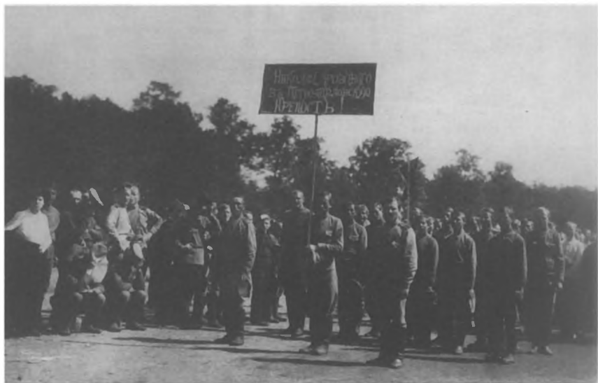
Солдатская манифестация на Марсовом поле. 1917 г.