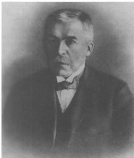
П. Н. Дурново