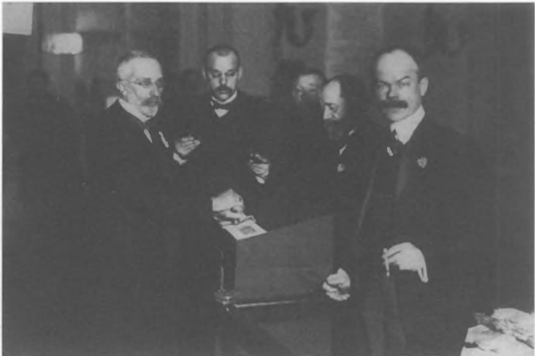
Опечатывание урны по окончании голосования по выборам в Государственную думу. 1907 г.