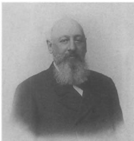
Д. С. Сипягин