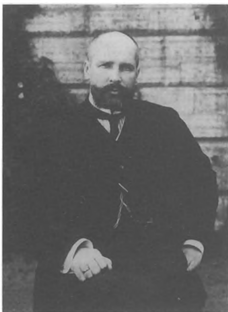
П. А. Столыпин