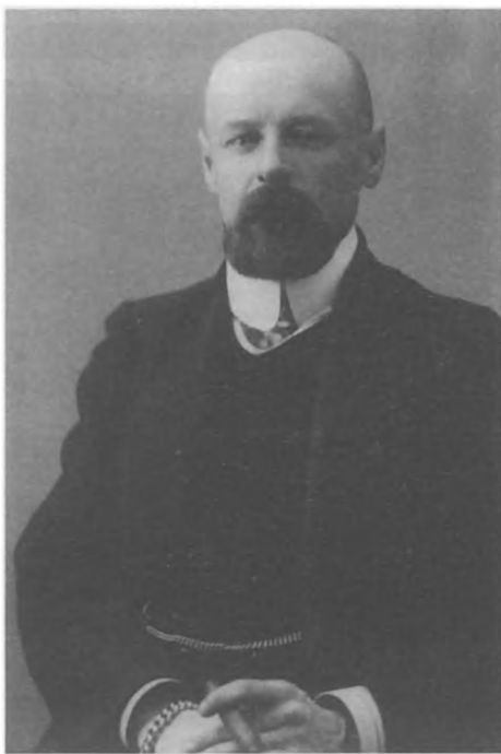
В. М. Пуришкевич