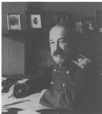
П. Д. Святополк-Мирский