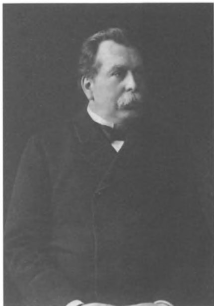
В. К. Плеве