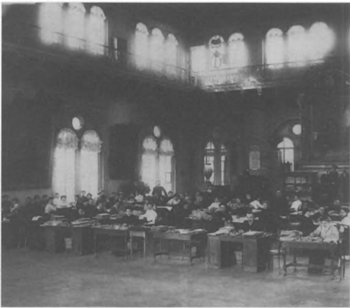
Выборы в I Государственную думу. Рабочий аппарат столичной избирательной комиссии. 1906 г.