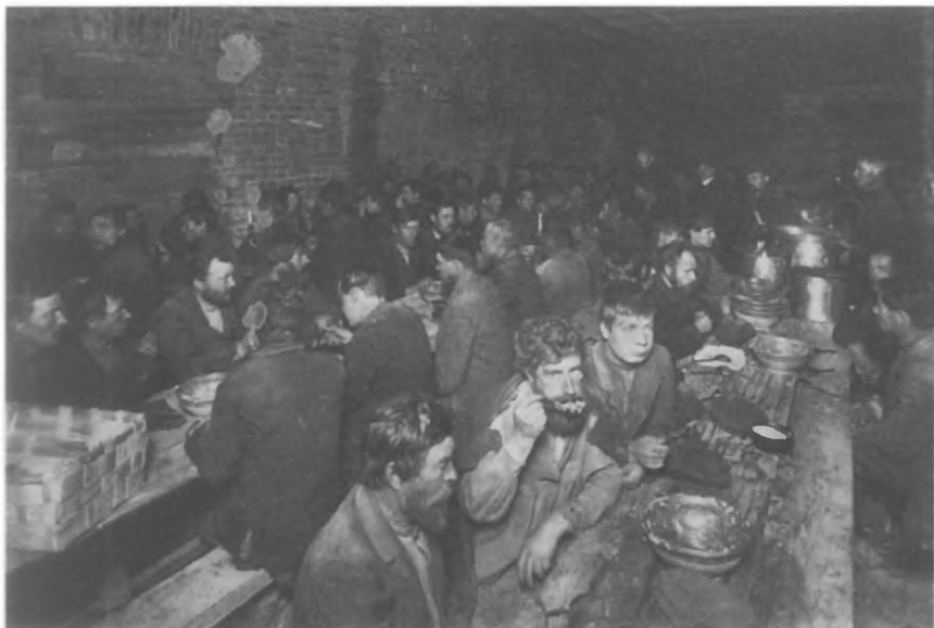
Столовая для бедных в Петербурге. 1911 г.