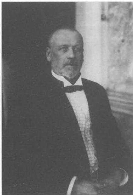
М. В. Родзянко