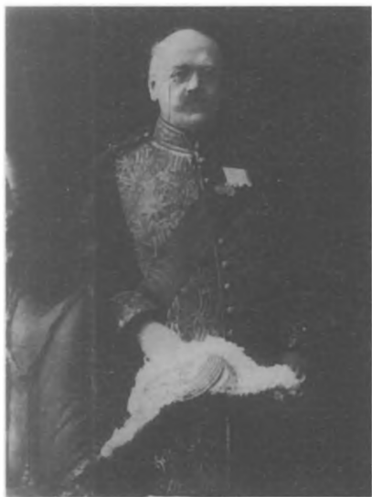
А. Ф. Трепов