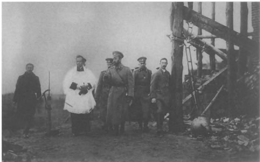
Николай II в районе боевых действий. 1915 г.