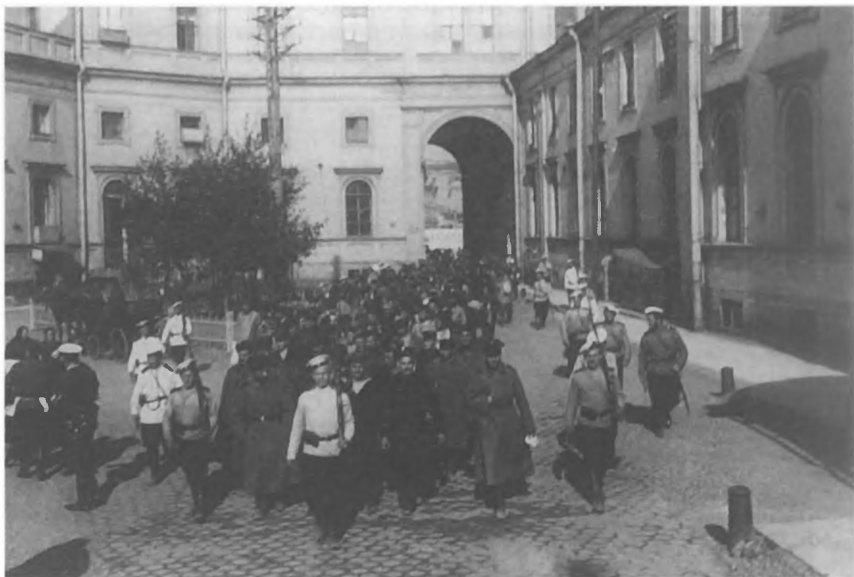
Отправка политических заключенных в ссылку. Николаевский вокзал. Петербург, 1906 г.