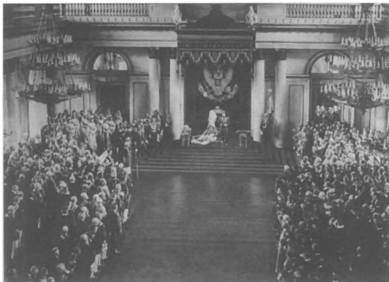
Выступление Николая II перед членами Государственного совета и Государственной думы 27 апреля 1906 г.