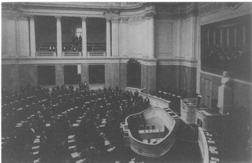
Заседание Государственного совета. 1906 г.