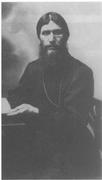
Г. Е. Распутин