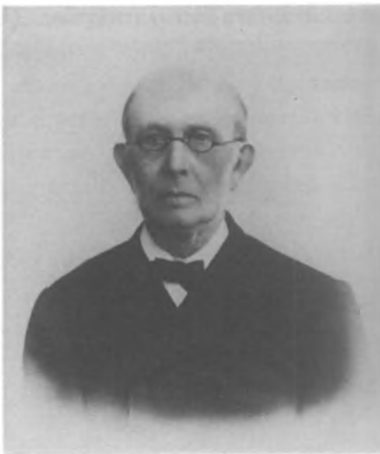
К. П. Победоносцев