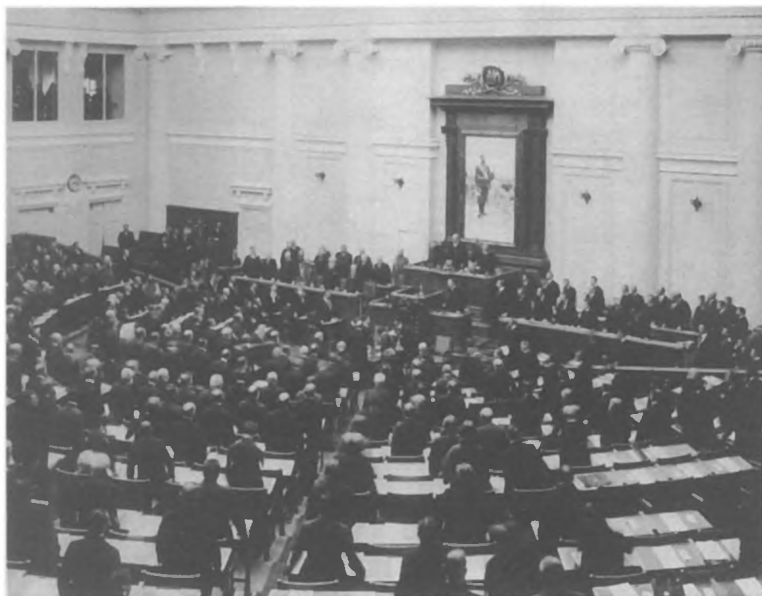
Заседание Государственной думы. 1911 г.