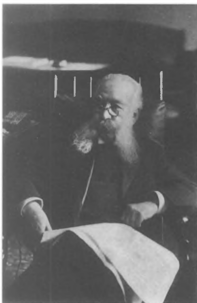
И. Л. Горемыкин