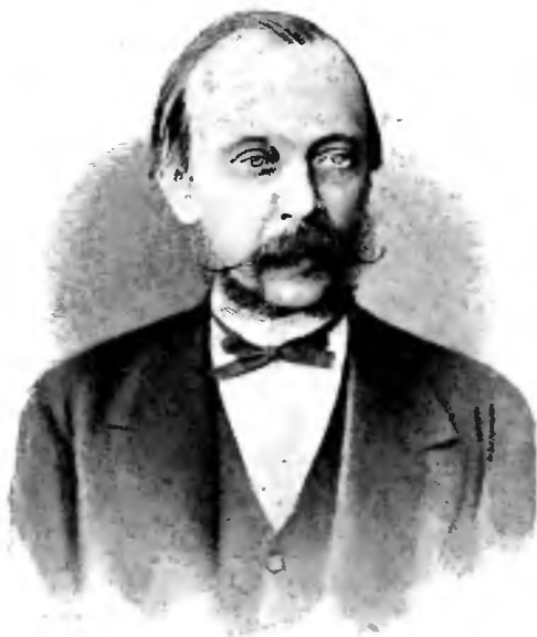
Гр. Д. А. Толстой.

Еще важѣе были мѣры, принятыя министерствомъ для подготовки учителей желательнаго для него типа. Съ этою цѣлью были учреждены казенные учительскіе институты и семинаріи, а семинаріямъ, возникшимъ по инициативѣ земствъ, были поставлены такія препятствія на пути ихъ развитія, что часть ихъ была закрыта, а другая передана всецѣло въ вѣдѣніе Министерства Нар. Просвѣщенія.