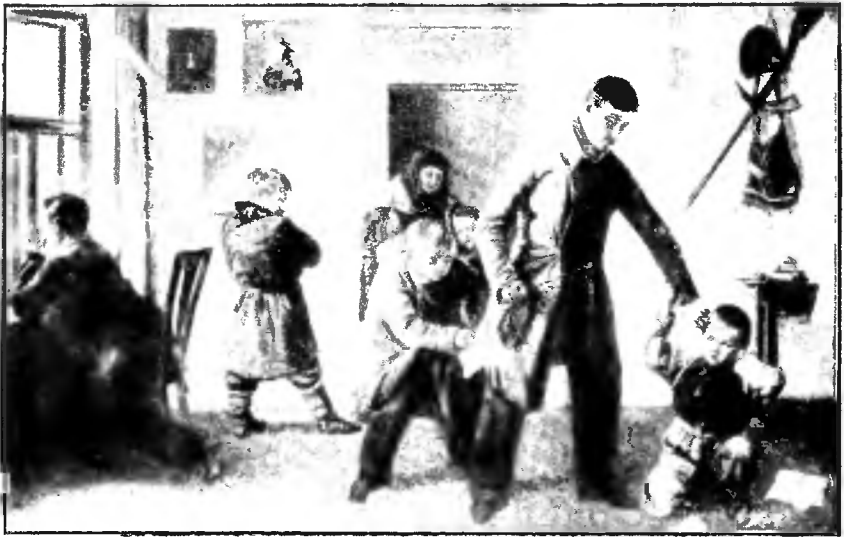
Въ дореформенной школѣ. Съ картины Панова.

Мы видѣли, что земства при началѣ своей дѣятельности нашли уже на территоріи уѣздовъ нѣкоторое количество школъ, большая часть которыхъ содержалась крестьянами. Первые земскіе отчеты даютъ нѣкоторое представленіе о томъ, кто были учителя этихъ школъ. Повидимому, требованія отъ учителей въ крестьянской средѣ стали къ этому времени нѣсколько повышаться, и потому рядомъ съ своими братьями, малограмотнымъ крестьяниномъ, крестьяне охотно принимали въ учителя и болѣе образованныхъ горожанъ, изъ окончившихъ уѣздное или