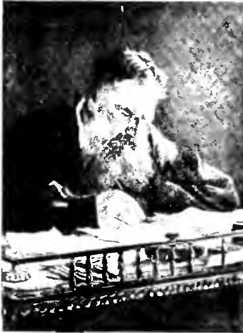
Л. Н. Толстой.

полѣ на войнѣ, и вернулся въ Ясную Поляну уже извѣстным писателемъ. Хотя онъ никогда не стоялъ особенно близко къ литературнымъ кружкамъ, но не ушелъ отъ влияния того течения, которое захватило лучшую часть общества конца 50-хъ годовъ. Такъ же, какъ и всѣ, Толстой начинаетъ интересоваться педагогическими вопросамъ