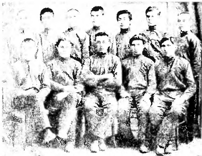
Группа воспитанниковъ Казанской учительской семинарии.

мления. Не надо тут начинать смотреть, какъ на учрежденіе, которое только заставляетъ дѣтей забыть свое родное языкъ и научить владѣть русскимъ языкомъ, чтобы они стали ихъ разговорнымъ языкомъ. Выдѣтся такъ называемый натуральный методъ обученія русскому языку, т. е. русскому языку начинаютъ обучать безъ употребленія родного языка. Учитель показываетъ предметы, производитъ различныя дѣйствія, все это называетъ по-русски и заставляетъ учени-