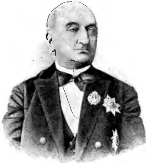
Графъ Н. Д. Деляновъ.

Въ началѣ слѣдующаго 1882 года новый министръ народнаго просвѣщенія, баронъ Николан, представилъ свое заключеніе по этому вопросу, въ которомъ доказывалъ, что укрѣпленіе въ народѣ сознательнаго религіознаго чувства вполне возможно и при помощи школъ Министерства Народнаго Просвѣщенія и что для этого нѣтъ надобно-