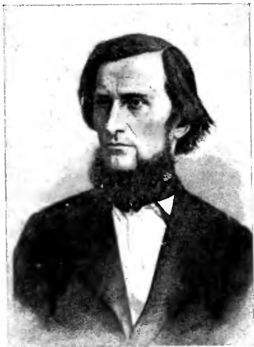
К. Д. Ушинскій.

начальную школу, въ которой всё занятія идутъ по его системѣ. Эта опытная школа была тѣмъ учрежденіемъ, въ стѣнахъ которой сложился типъ русской народной школы. Для этой школы были составлены книги «Дѣтскій Міръ»; практика занятій въ ней дали Ушинскому матеріалъ и для «Родного Слова», а его теоретическія занятія