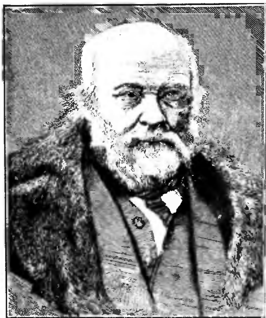
Н. П. Пироговъ.

Статья эта сразу обратила на себя вниманіе общества. Она имѣла огромный успѣхъ, не было образованнаго человѣка, который не прочелъ бы ея, не подумалъ бы надъ нею. О ней говорили и въ свѣтскихъ гости-