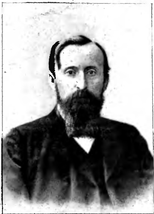
Кн. Д. Н. Шаховской.

Министерство Внутренних Дѣлъ закономъ о предѣльности земскаго обложенія, издавшимъ въ 1900 году. Не задолго до изданія этого закона нѣкоторые изъ земствъ, стремясь къ скорѣйшему осуществленію всеобщаго обученія, въ нѣсколько лѣтъ увеличивали свой бюджетъ по этой отрасли земскаго хозяйства въ 2 и даже 3 раза. Дальнѣйшій