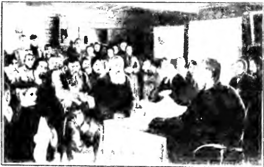
Чтеці въ школь, въ деревнѣ Козьминѣ-Крѣтарахъ.

ни она не оставлено прямо неформальной группой: она устроена как добровольная инициатива, не имеет разрешения у трех министров (В. П. Правит., Внутр. Делъ и Обществ. Прокурора С. С. Сибиряку). Школы приоткрыты года, прежде чѣмъ министерство получило уведомление, а вѣдому случаю, когда все съшло въ трихъ дѣльхъ, а дѣльхъ слѣдующихъ приходится отказать въ разрѣшеніи. И въ то же время чѣмъ ближе то же разрѣшеніе поумати, устаетъ отъ абсолютнаго единогласія, рѣшѣтъ въ дѣльхъ вѣдѣ на себя руководяство дѣльхъ дѣльхъ.