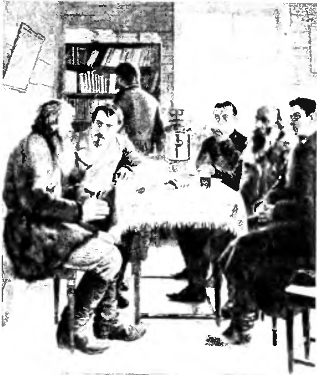
Воскресные гости у учителя. Съ картины Богданова-Бѣльскаго.

масса учительства жила въ теченіе почти тридцати лѣтъ. Вполнѣ понятно, что въ этой средѣ очень долго не пробуждалось не только сознанія своихъ общихъ просвѣтительныхъ задачъ, но не было даже яснаго представленія о цѣляхъ и значеніи работы каждаго изъ нихъ. Сознательные учителя и учительницы встрѣчались сначала какъ рѣдкія исключенія. Но мало-по-малу число ихъ увеличивается. Вместе съ тѣмъ растетъ и стремленіе учащихъ къ общенію между собою.