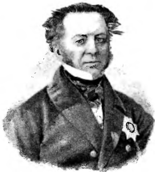
А. С. Норовъ.

школьнаго дѣла, необходимость которой была всеми признана. Самый проект реформы высшей школы былъ разработанъ уже при преемникѣ Норова, Е. П. Ковалевскомъ. Трудъ этотъ былъ въ февралѣ 1860 г. напечатанъ въ журналѣ Министерства Народнаго Просвѣщенія и предложенъ на обсужденіе совѣтамъ среднихъ и высшихъ учебныхъ заведеній и всемъ желающимъ а равно и ученымъ обществамъ проектъ этотъ былъ разосланъ особо, и имъ также было предложено высказать на него свои замѣчанія. Наконецъ, онъ былъ переведенъ на французскій и нѣмецкій языки и разосланъ извѣстнымъ педагогамъ,