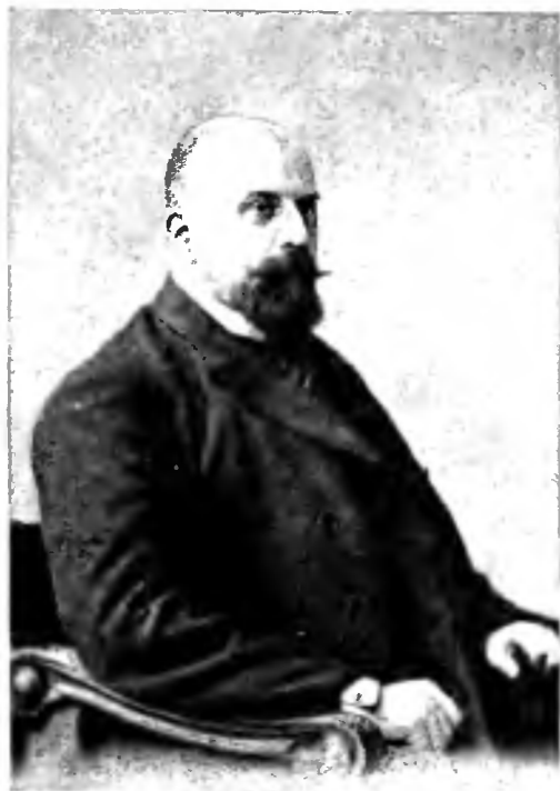
Князь Пётръ Дмитріевичъ Долгоруковъ.

доступъ на нихъ былъ широко открытъ для учащихся другихъ губерній, а многія лекціи съ преніями происходили даже публично. Особенную роль сыграли въ этомъ отношеніи курсы, бывшіе въ томъ же Курскѣ лѣтомъ 1902 г. Одновременно съ курсами земство устроило въ этотъ годъ и первую всероссійскую выставку по народному образованію. Выставка эта привлекла очень много земскихъ дѣятелей, а учащіе организовали цѣлый рядъ экскурсій для ея