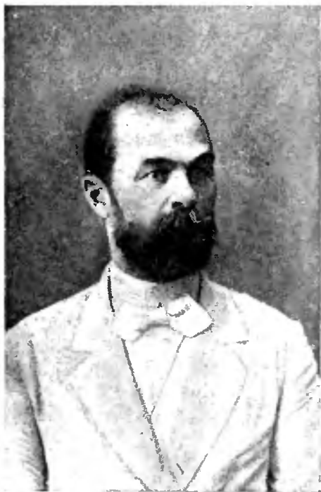
В. П. Вахтеровъ.

чительныя. Онъ считалъ, что всеобщее обученіе можетъ быть достигнуто при ежегодной затратѣ 12 милліоновъ. Не надѣясь на то, что земства могутъ увеличить свой школьный бюджетъ на эту сумму (земства тратили тогда на народное образованіе около 6.000.000), онъ предлагалъ ходатайствовать объ ассигнованіи этой суммы въ пособіе земствамъ отъ правительства, но безъ огражденія ихъ компетенціи.