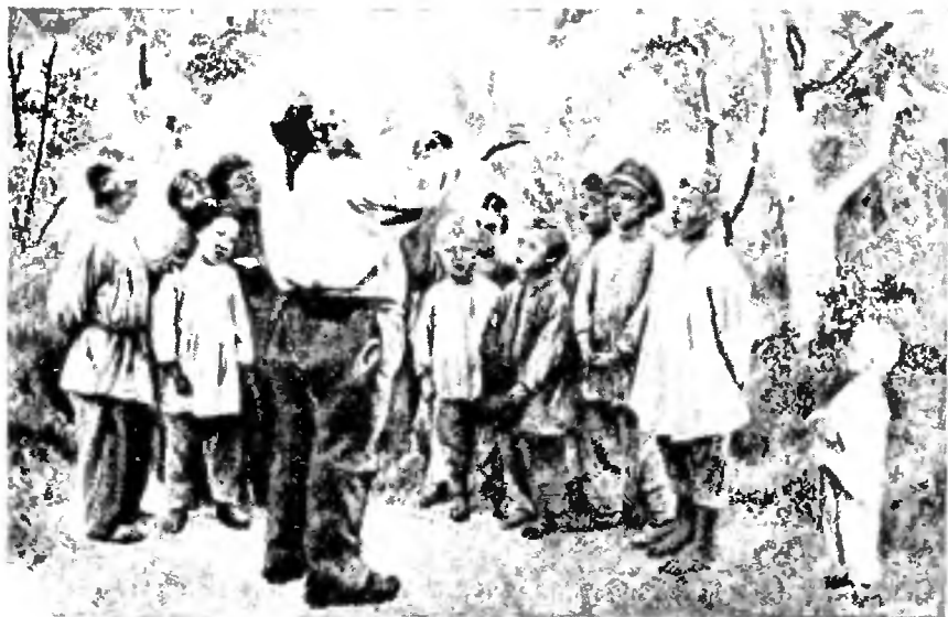
Ученическій хоръ. Съ картины Ярошенко.

школы выдвигается целый ряд обвинений. Школу эту стали считать в томъ, что она носит не соответствующій потребностямъ и духу русскаго народа свѣтскій характеръ, отодвигаетъ на задній планъ и Законъ Божій, и церковно-славянское чтеніе, и церковное пѣніе. Въмѣсто того она сообщаетъ совершенно ненужныя въ деревенскомъ быту естественно-историческія знанія и распространяетъ чуждыя русскому народу и даже вредныя для него идеи. И при всемъ томъ, эта свѣтская школа развивается такъ медленно, что трудно предвидѣть, когда она обезпечитъ всему населенію Россіи начальную грамоту. А между