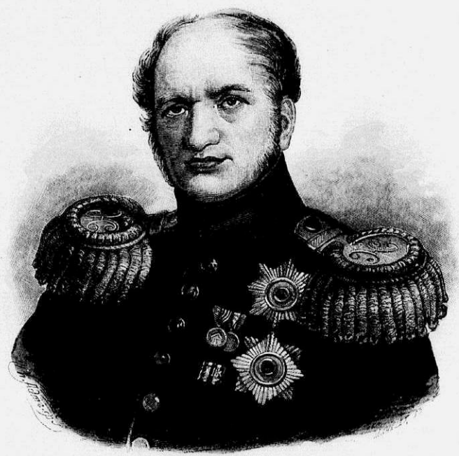
Е. Ф. Канкринъ.